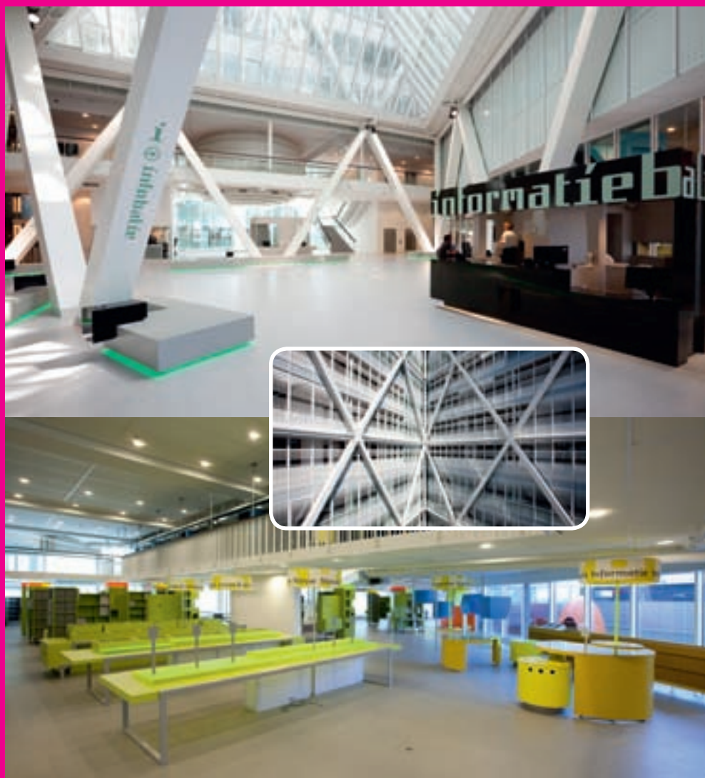
(Foto boven) De entree van het Stadskantoor is licht en ruim. De medewerkers aan de informatiebalie verwelkomen u en wijzen u de weg. (Foto onder) De kleurrijke bibliotheek nodigt uit om te lezen en te lenen. (Inzet) De architectuur van het duurzame gebouw is fris, speels en futuristisch.