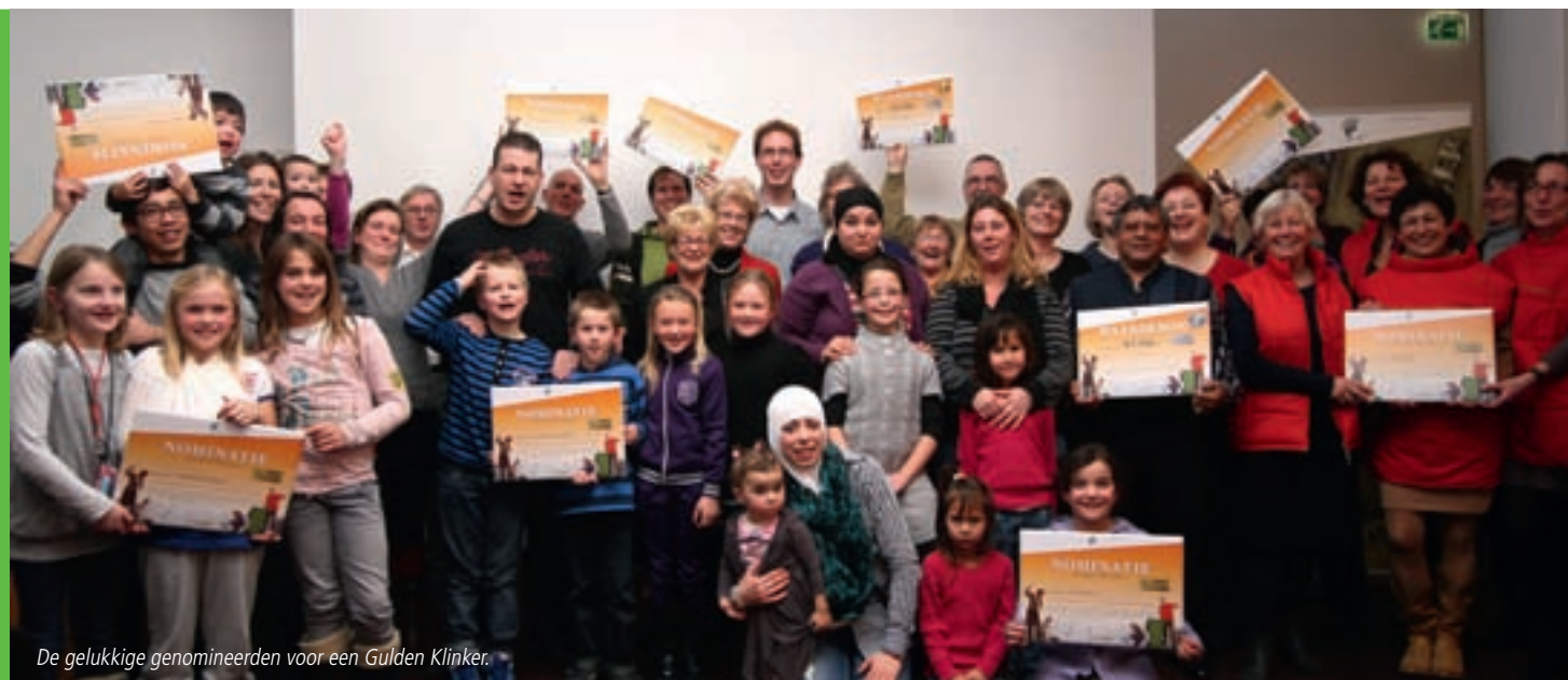
De gelukkige genomineerden voor een Gulden Klinker.

Vestia en Stichting Boog namen het initiatief om een groep ouders en kinderen actief in te zetten voor hun buurt. Die groep werd de Oordenkids. Met hun activiteiten brengen zij bewoners dichter tot elkaar. Eén keer per twee weken prikken de kinderen papier en vegen ze de binnentuinen, stoepen en straten. Houden ze dit een jaar vol, dan maken ze eind 2011 kans op een bedrag van 1.300 euro. Een bedrag dat ze goed kunnen gebruiken voor de buurt.