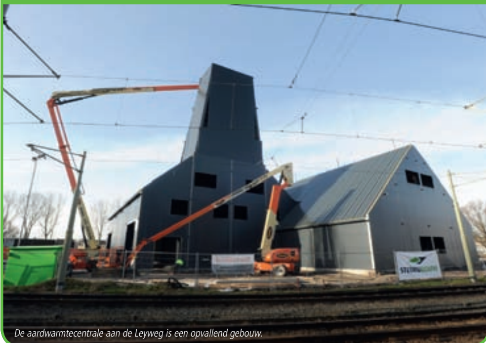
De aardwarmtecentrale aan de Leyweg is een opvallend gebouw.