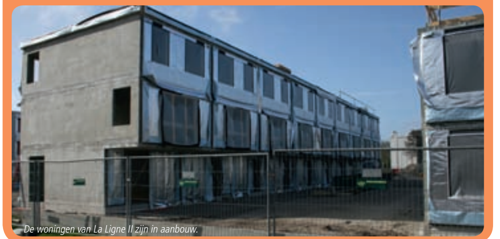
De woningen van La Ligne II zijn in aanbouw.

en een parkeergarage voor onze auto, die we direct vanuit de berging kunnen betreden. Ook kijk ik uit naar de vloerverwarming in het huis. Dat we het strand in Scheveningen achterlaten, vinden we niet erg. We krijgen er een heerlijk park voor terug waar we kunnen Nordic walken. Ook voor de broodnodige ontspanning gaan we naar het theater of de vele andere uitgangsmogelijkheden in het park.’