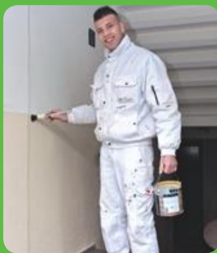
In opdracht van Haag Wonen voert de aannemer schilderwerkzaamheden uit in de Hardenbroekstraat.

In de Hardenbroekstraat krijgen 36 woningen een opknapbeurt. In opdracht van Haag Wonen voert aannemersbedrijf Van Lochem de nodige herstelwerkzaamheden uit en schildert de