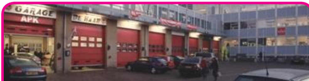
De Kazerne: verschillende bedrijven en kantoren onder één dak.

'Zuidwest is de wijk met de hoogste werkloosheid in Den Haag. Er moet dus nog een hoop gebeuren. Door bedrijfsruimtes te bieden, de regels te versoepelen en bestemmingsplannen flexibeler te maken versterkt de economie. Ook worden er nieuwe huizen gebouwd, woningen opgeknapt en meer voorzieningen aangeboden. In combinatie met betere omstandigheden voor ondernemers ontstaat zo een stadsdeel waar je prettig kunt leven, werken en recreëren.'