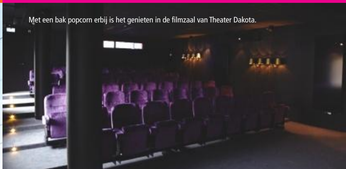
Met een bak popcorn erbij is het genieten in de filmzaal van Theater Dakota.