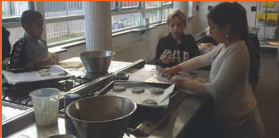
Kinderen bakken koekjes voor het uitwisselingsproject 'Niet wit, niet zwart'.

Het uitwisselingsproject 'Niet wit, niet zwart', een opknopbeurt van het schoolplein van De Kleine Wereld in Moerwijk en koken voor ouderen in wijkcentrum Eeldepad. Het is een greep uit de kansrijke projecten van de Leef Ruim-campagne 'Er is ruimte voor uw ideeën' die bewoners en de gemeente Den Haag dit jaar hebben gerealiseerd.