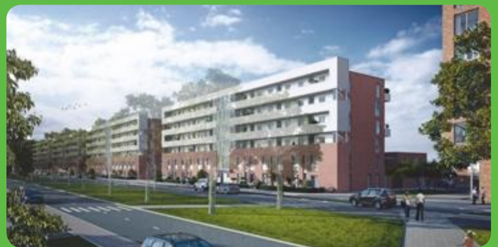
Quattro: wonen in fraaie appartementen en maisonnettes.