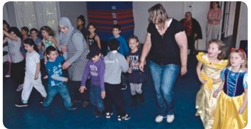
Dansen, knutselen, spelen. Bij Ontmoetingscentrum Morgenstond kan het allemaal.

Ontmoetingscentrum Morgenstond 1e Eeldepad 3a 2541 JG Den Haag