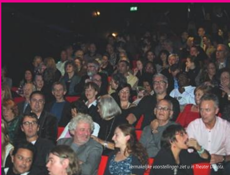
Vermakelijke voorstellingen ziet u in Theater Dakota.

Een middagje bioscoop of een avondje theater? Theater Dakota maakt het mogelijk en opende op 4 november zijn deuren in Escamp in ZUID57.