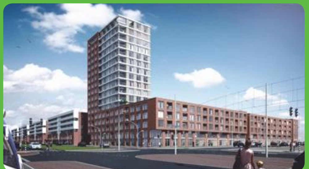
Il Vetro: koop- en huurwoningen en een imposante woontoren.