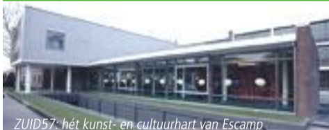
ZUID57: hét kunst- en cultuurhart van Escamp.

Een oude school in Zuidwest is door Vestia Den Haag Zuid-West, in samenwerking met de gemeente Den Haag, omgetoverd tot hét kunst- en cultuurhart van Escamp. In ZUID57 komt alles samen en wordt u overspoeld met creativiteit.