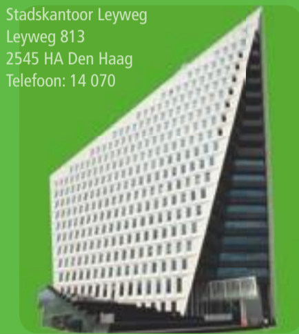
Het Stadskantoor aan de Leyweg.

Stadskantoor Leyweg Leyweg 813 2545 HA Den Haag Telefoon: 14 070