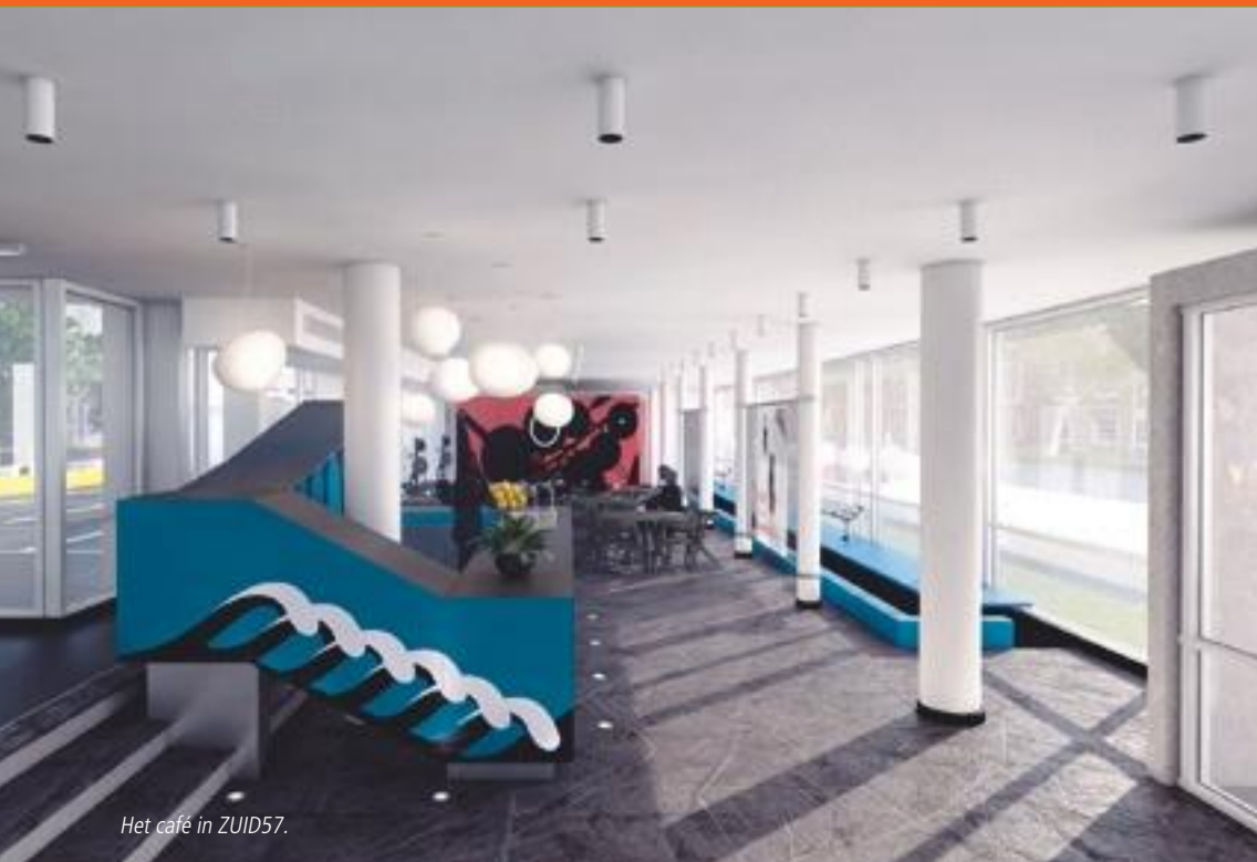
Het café in ZUID57.