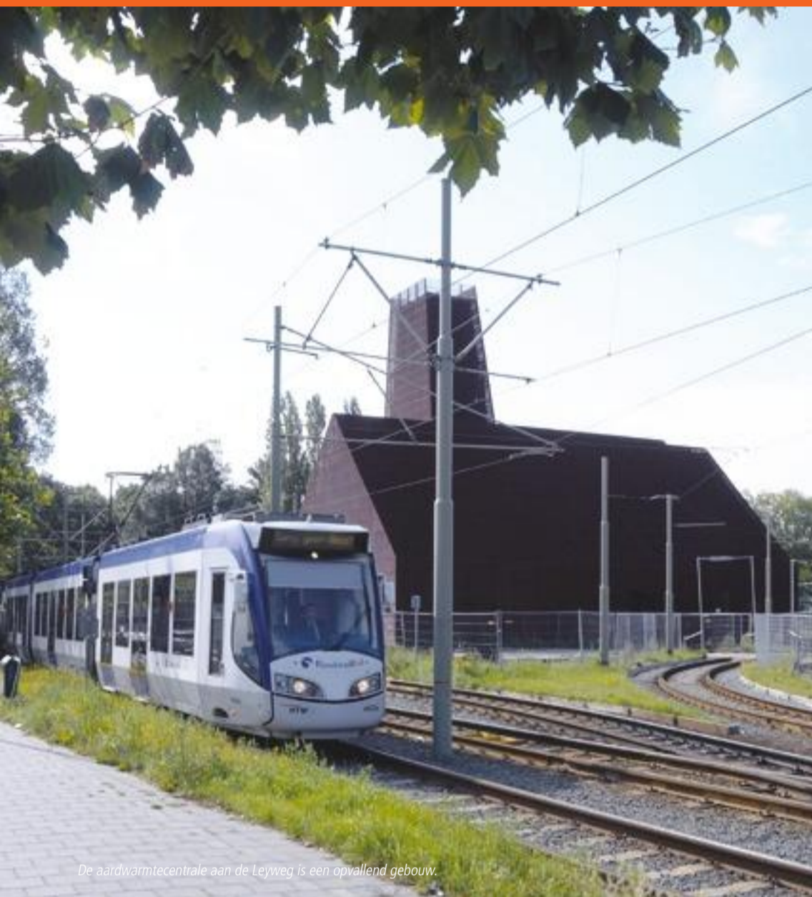
De aardwarmtecentrale aan de Leyweg is een opvallend gebouw.